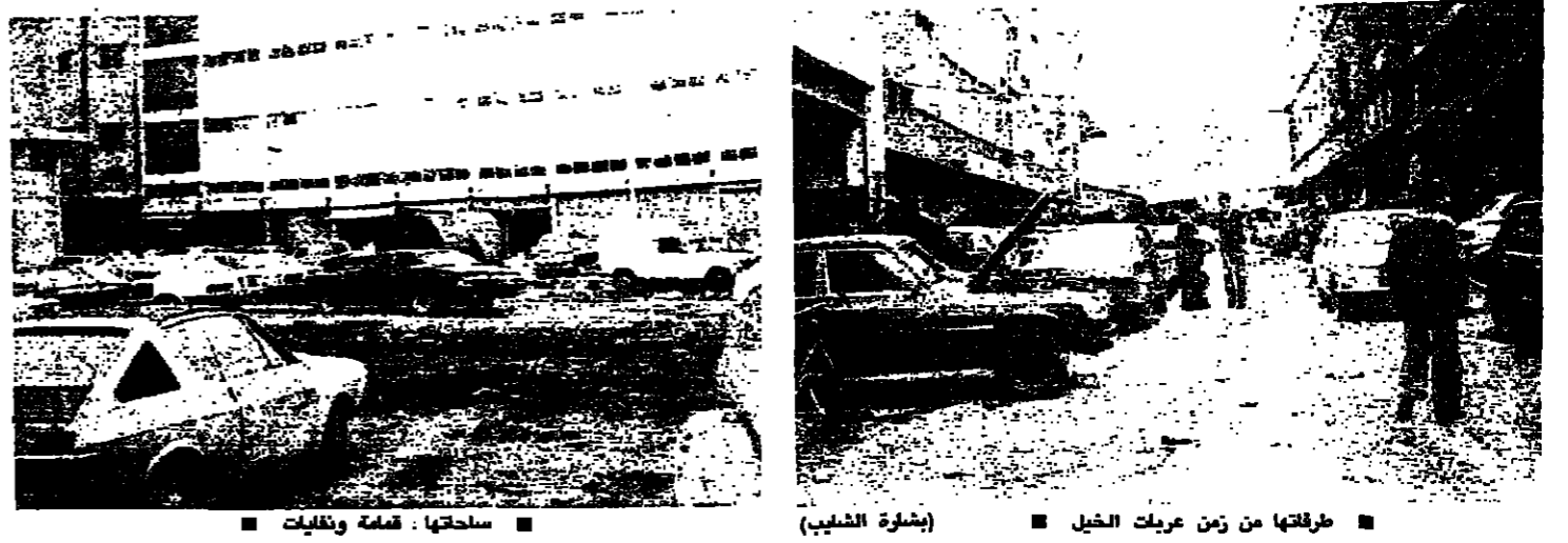
مخيمات من زمن عريات الخيل (بشارة الشهاب)